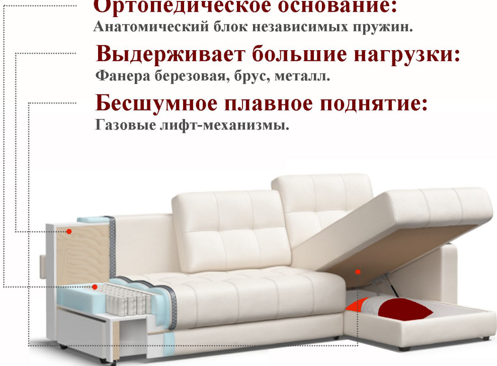
2 бельевых ящика

Для любящих комфортный сон, ведущих здоровый образ жизни. Срок службы 7 лет.